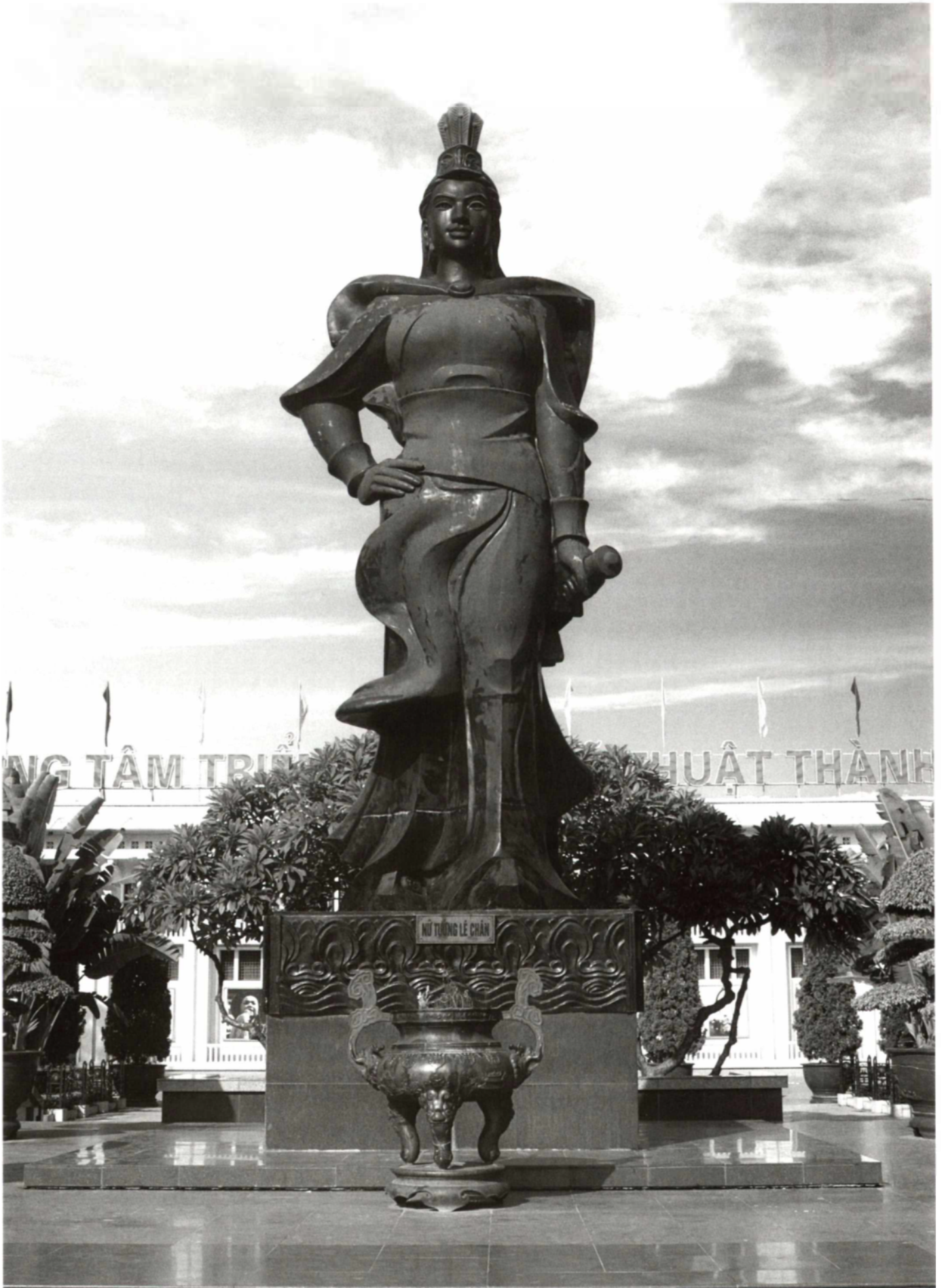
Tượng đài nữ tướng Lê Chân tại trung tâm thành phố